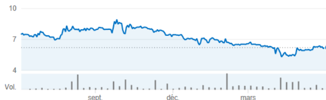
Evolution du cours juin 2016-juin 2017

Le dernier cours coté, le 8 juin 2017, était de 6€ soit une capitalisation boursière de 20,8 M€.